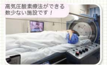
高血圧素療法ができる 数少ない施設です！