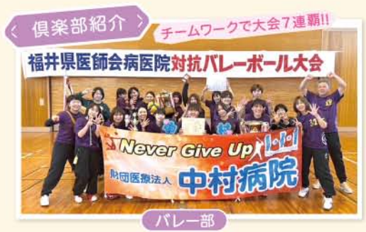
< 倶楽部紹介 >