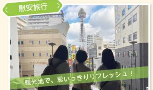
< 慰安旅行 >