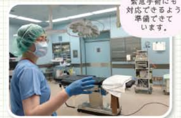
緊急手術にも 対応できるように 準備できて います。