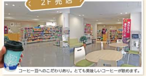
< 2F 売店 >