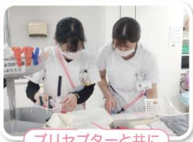
プリセプターと共に