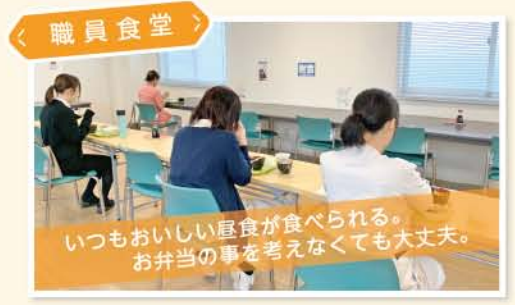
< 職員食堂 >