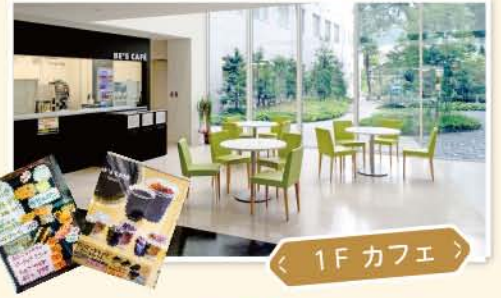
< 1F カフェ >

日勤：8:30～17:30 夜勤：17:00～翌朝9:00 早番：7:00～16:00（月1回程度） 新人は5月末より月1回の夜勤スタート 年度末までに徐々に月4回までアップし、夜勤独り立ちします。