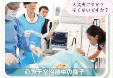
大丈夫ですか？ 辛くないですか？