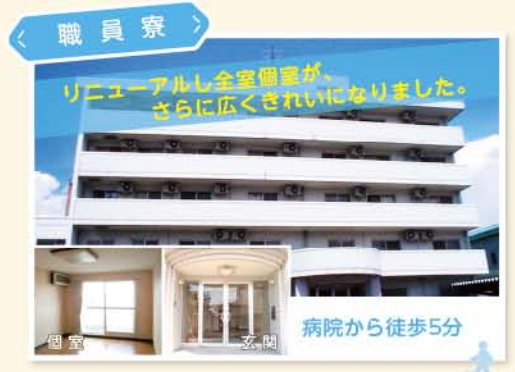
< 職員寮 >