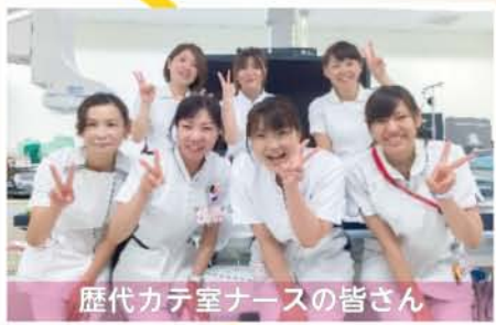
歴代カテ室ナースの皆さん