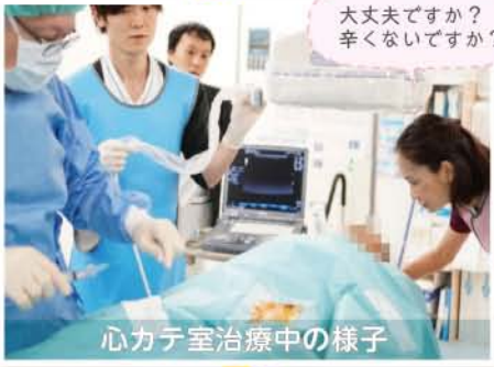
心カテ室治療中の様子